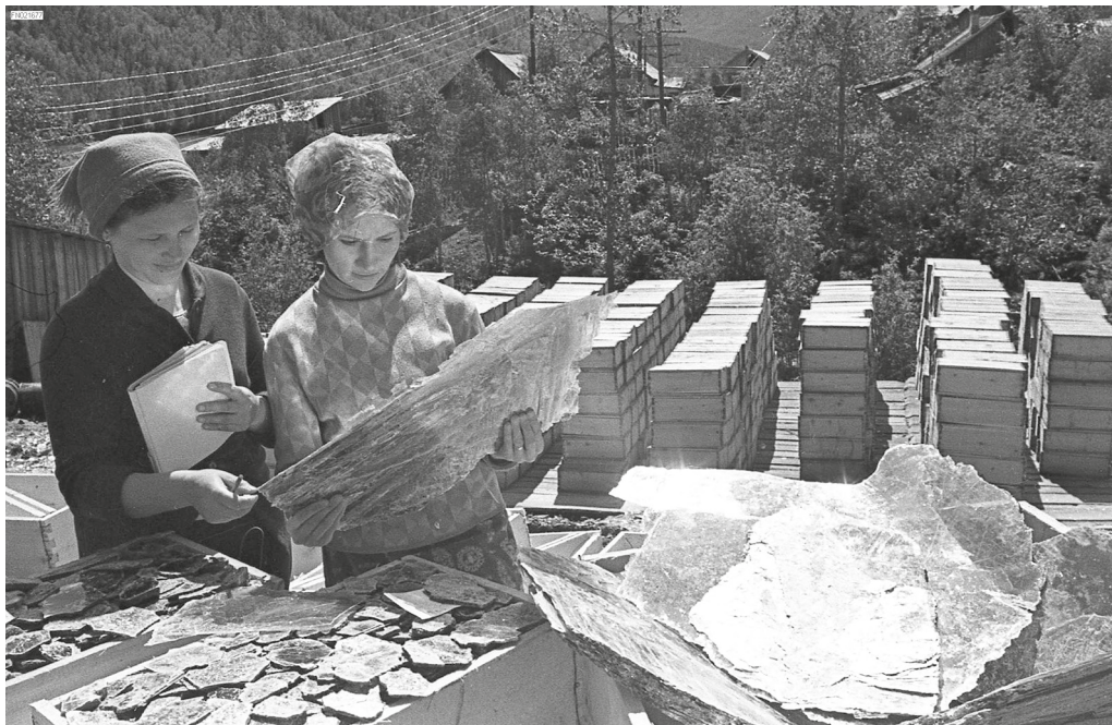
Рис. 1. Цех обработки слюды в пос. Витимский. 1970 г.

ных регионов России. Благодаря воле к жизни этих людей, привыкших трудиться на земле, экономические показатели района уже в 1932 г. резко пошли в гору 10 .