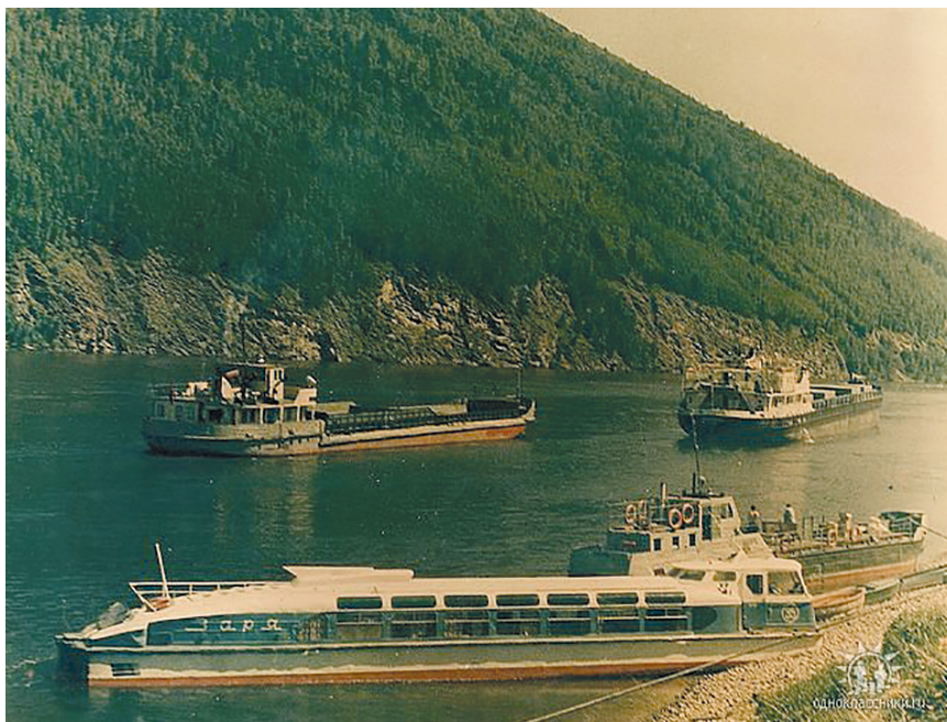
Рис. 7. Мамская пристань. Самоходные суда и пассажирский теплоход «Заря». Начало 1980-х.