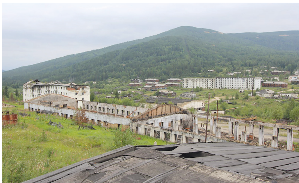
Рис. 3. Поселок Согдиондон. Фото 2018 г.