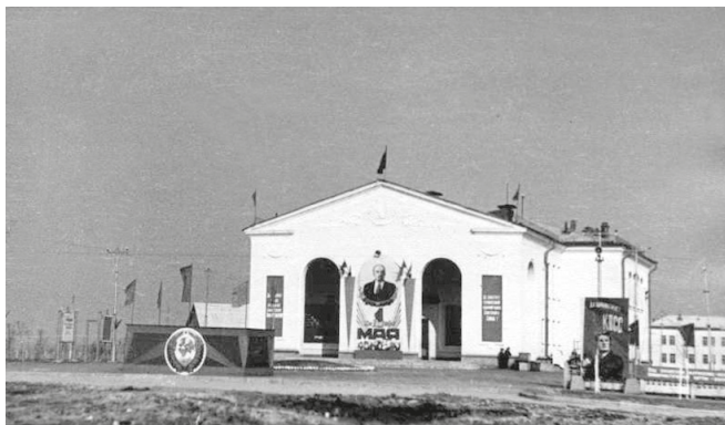
Рис. 4. ДК «Нефтяник» (позднее ДК «Октябрь»). Кстово, 1957 г. [Из коллекции Кстовского историко-краеведческого музея (ИКМ-4961)]