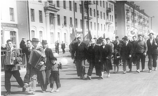
Рис. 2. Колонна демонстрантов на Магистральной улице. Кстово, 1960-е гг.