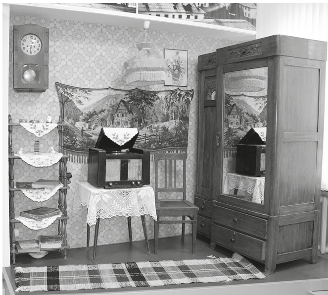
Рис. 10. Интерьер комнаты в первых жилых домах. Фрагмент экспозиции «Юный город на древней земле». Кстовский историко-краеведческий музей, 2017 г.

рез аскетичные интерьеры палатки и конторы Управления начальных работ на экспозиции (рис. 9).