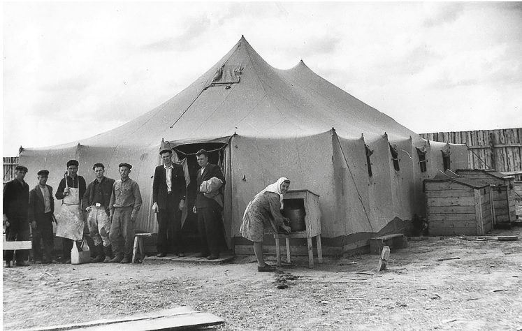
Рис. 7. Первостроители у палатки. Кстово, 1951 г.

ми проведения досуга, но и с повседневной и праздничной одеждой, обстановкой жилищ, приемами сервировки стола и многим другим.