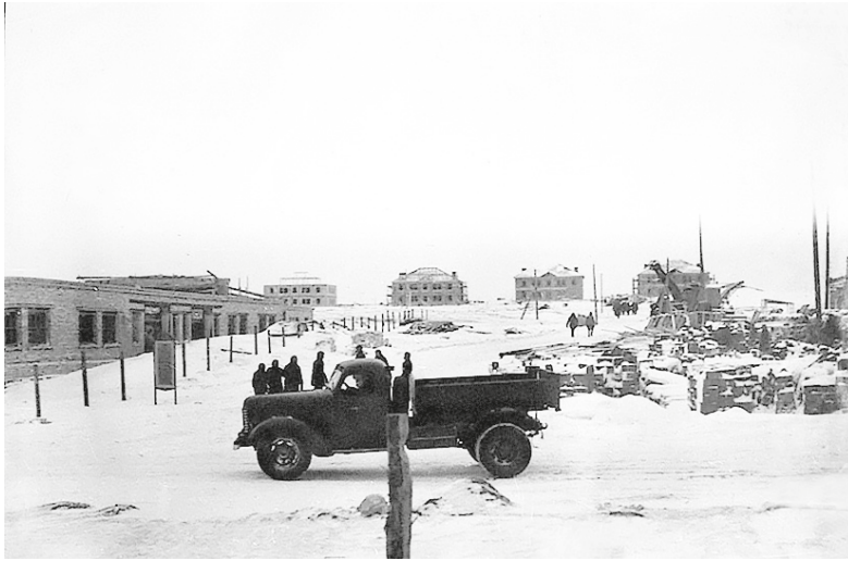
Рис. 1. Строительство Щитков. Кстово, 1952 г.

Действительно, авторы «Истории советской архитектуры», увидевшей свет в 1962 г., характеризуют щитовые конструкции как один из видов временных облегченных конструкций, получивших распространение в 1940 — начале 1950-х гг. 16 После получения рабочим поселком Кстово статуса города «был разработан генплан развития города, где за основу была принята традиционная прямоугольная схема жилых кварталов. Небольшие масштабы Кстова обусловили компактность его застройки и определили этажность зданий с преобладанием малоэтажной (до пяти этажей) и частично девятиэтажной застройки» 17 . После этого еще масштабнее разворачивается капитальное жилищное строительство. На фотографии (рис. 2) на одной из первых улиц города — Магистральной — можно видеть праздничную демонстрацию, фоном для этого мероприятия выступают величественные дома: «В 1958–1959 годах улица Магистральная, идущая вдоль трассы Москва — Казань, застраивается домами так называемой “постсталинской” архитектуры с богатой пластикой оштукатуренных фасадов, обусловленной наличием эркеров, полуколонн, карнизов сложного профиля, декоративных лепных деталей. В застройке прилегающих к Магистральной улице кварталов были применены проекты ленинградских архитекторов» 18 .