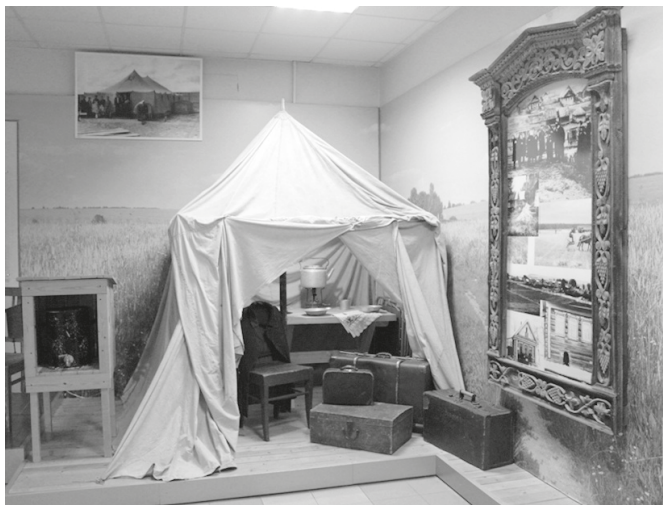
Рис. 9. Интерьер палатки. Фрагмент экспозиции «Первостроители». Кстовский историко-краеведческий музей, 2017 г.