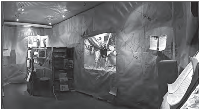
Илл. 6. Объект «Сундук Даниила Хармса» С. А. Якунина (1995–2016, собственность ГЛМ «XX век»); общий вид выставки «Библиотека Хармса» (Музей-квартира М. М. Зощенко, 2016). Архив ГЛМ «XX век». Фото М. А. Кривоспицкого