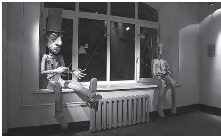
Илл. 7. Скульптуры С. А. Якунина; слева направо: «Даниил Хармс» и «Михаил Зощенко» (2016, собственность ГЛМ «XX век»); фрагмент выставки «Библиотека Хармса» (Музей-квартира М. М. Зощенко, 2016).