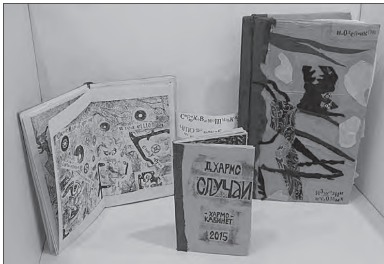
Илл. 1. Книги художника авторства С. А. Якунина из фонда графики ГЛМ «XX век»; слева направо: «Охотники» (2013, экз. 23 из 24), «Случаи» (2015, экз. 13 из 15), «Из жизни насекомых» (2014, экз. 2 из 4). Архив ГЛМ «XX век». Фото С. Б. Горбунова