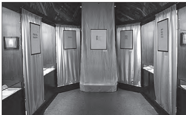
Илл. 8. Общий вид выставки «Поэзия в зернах» (Музей-квартира М. М. Зощенко, 2015).

Общеизвестно и логично, что обязанность сохранения культурных ценностей, находящихся в ведении музеев, возложенная на них Федеральным законом «О Музейном Фонде Российской Федерации и музеях в Российской Федерации» № 54-ФЗ (ст. 16), должна обеспечиваться органами исполнительной власти на местах (ст. 18). При этом апеллированию к закону препятствует несформулированность самих понятий разрушения и физической сохранности (ст. 16) в отношении объекта актуального искусства. Стоит ли, например, для предотвращения (взаимных) повреждений отделять разнородные компоненты произведения друг от друга при наличии такой возможности? Не приведет ли это нарушение целостности к пресловутому разрушению предмета (даже в идеологическом смысле), что, согласно Федеральному закону № 54-ФЗ, выступает основанием для отчуждения такового из Музейного фонда (ст. 15)? Ограничение же сохранности исключительно физической составляющей при действующей «Международной