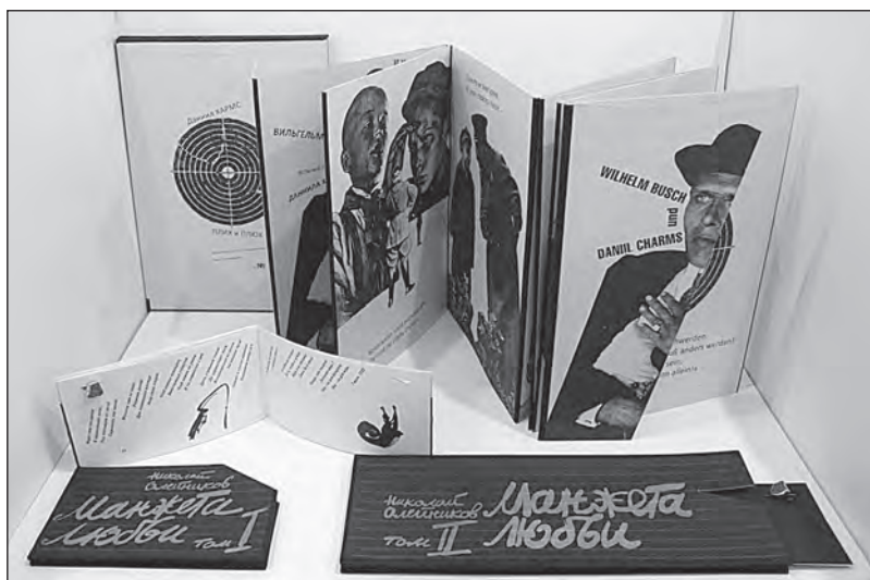
Илл. 2. Книги художника авторства М. С. Карасика из фонда графики Государственного литературного музея «XX век»; снизу вверх: «Манжета любви» — тома I и II (1994, экз. 17 из 37), «Плих и Плюх / Plisch und Plum» (2014, экз. 13 из 13). Архив ГЛМ «XX век». Фото С. Б. Горбунова

Русский музей (отдел гравюры XVIII—начала XXI в.) и Государственный музей «Царскосельская коллекция» (фонд живописи, фонд графики), или из «формы» предмета или его компонентов — вид книги — как Государственный Эрмитаж (Научная библиотека, числясь в которой книга художника и «книжный арт-объект» не являются единицами музейного фонда (!), и, насколько нам известно, Отдел истории русской культуры) и Государственный литературно-мемориальный музей Анны Ахматовой в Фонтанном Доме (фонд редкой книги).