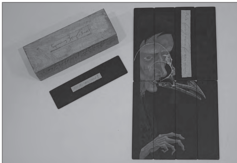
Илл. 3. Книга художника «Ворон» (2014) П. Ю. Перевезенцева из фонда графики ГЛМ «XX век». Архив ГЛМ «XX век». Фото С. Б. Горбунова

Обращение к произведениям, выполненным в смешанной технике, в первую очередь ассамбляжа и с использованием реди-мейдов, по-видимому, неизбежно приводит к принципиальной, базовой сложности на этапе инвентаризации — хранительского описания . Это происходит при оформлении инвентарных карточек после присвоения книге художника статуса музейной ценности, в актах при приеме таких произведений на временное хранение и при экспонировании в этикетаже (если в нем решено подробно рассказать о материале).