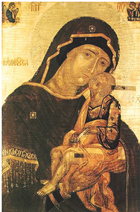
Рис. 6. Икона «Богоматерь Умиление», украденная в ночь с 3 на 4 декабря 1991 г. из Музея древнебелорусской культуры АН БССР [Сакральная живопись Беларуси XV–XVIII веков. Авт. текста и сост. Н. Ф. Высоцкая. 2007. Минск: Беларусь]

На поверхность вышла проблема возвращения из музеев предметов культа, изъятых из церквей и монастырей, закрытых в советское время. Эта проблема разделила общественное мнение на два лагеря. Одни говорили о нарушении государством прав верующих, лишении людей свободы вероисповедания, о профессиональном подходе к хранению религиозных предметов священниками Минского кафедрального собора, ксендзами Несвижского и Пинского костелов. Другие справедливо напоминали оппонентам, что только благодаря музейщикам эти вещи были сохранены для белорусской культуры в годы воинствующего атеизма, об отсутствии в большинстве церквей и храмов должных условий хранения, штатных искусствоведов, реставраторов и т. д. Аналогичная аргументация прозвучала и в отказе Министерства культуры вернуть католической общине деревни Гнезно