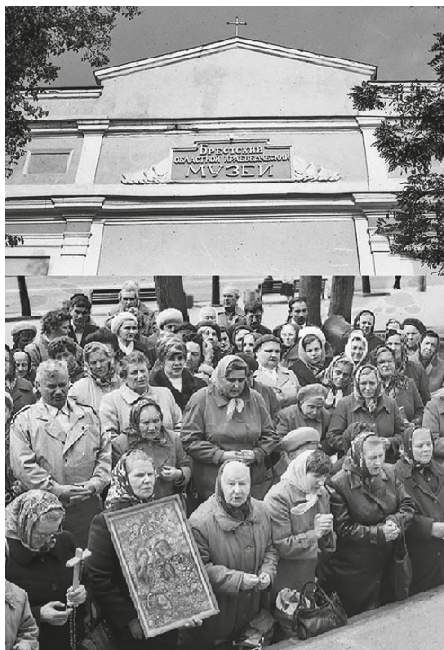
Рис. 5. Верующие у здания Брестского областного краеведческого музея.